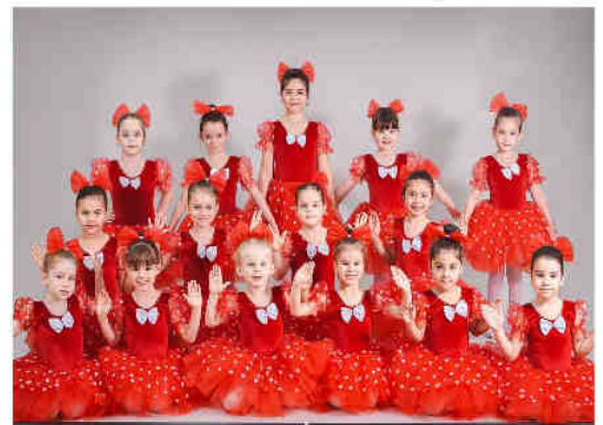
Cercul de balet "Petit Arabesque" •2022•